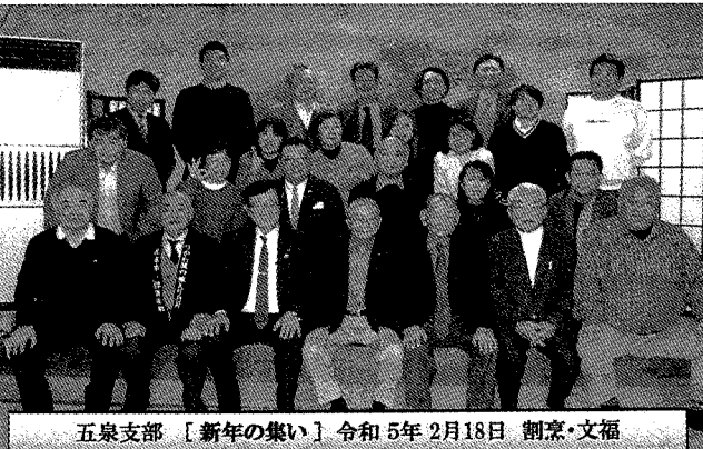
五泉支部【新年の集い】令和5年2月18日 割烹・文福

今年度は、支部総会もありませんが、来年度の支部総会に向けた準備を予定しております。さらに支部役員も高齢化しておりますので、役員の若返りと支部会員の若返りを予定しております。同窓会活動に興味のある方役員やってみませんか。おわりに、同窓会の目的である「会員相互の親睦」と「母校の発展」につながる活動を計画したいと考えておりますので、同窓会活動に関するご意見等ありましたらぜひお知らせください。